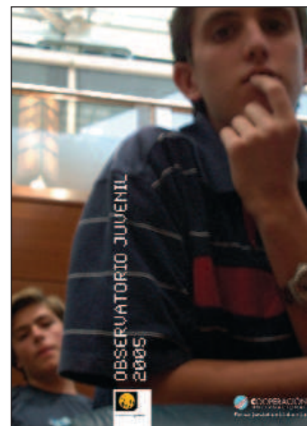
Portada del Observatorio Juvenil 2005.