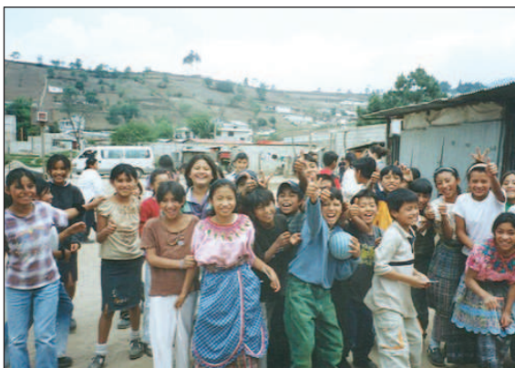
Niños y jóvenes de la ciudad de Pichincha, Ecuador.

El programa tiene una duración prevista de 3 años y persigue los siguientes objetivos : mejorar el acceso, la calidad y la equidad en la satisfacción de las necesidades básicas de educación de los niños de tres cantones; fortalecer las organizaciones civiles que trabajan en la re-