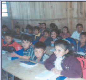
Un aula guatemalteca.