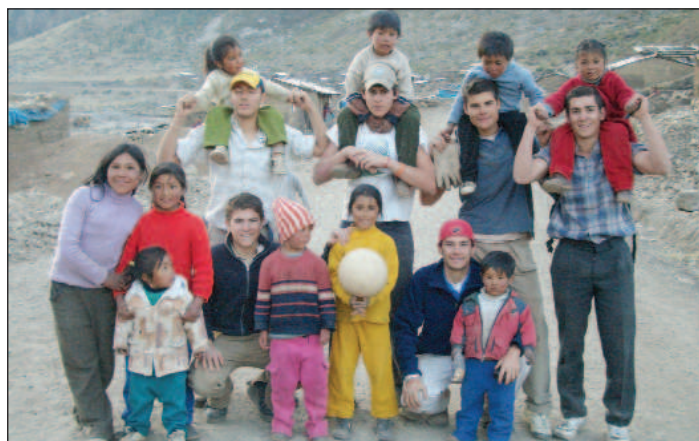
Voluntarios en el Campo de Trabajo de Huancavelica, Perú.

A través de intensas jornadas de trabajo, los voluntarios realizan distintas actividades de apoyo social, que benefician a más de 2.500 personas : educación y alfabetización de niños en escuelas de verano, formación de los pequeños en el ocio y en el tiempo libre, desarrollo social y apoyo asistencial a familias, construcción y rehabilitación de viviendas, atención sanitaria, asistencia a personas mayores y discapacitados, etc.