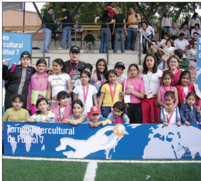
Imagen de algunos de los participantes en el torneo.

Durante los descansos de los partidos, los niños pudieron disfrutar de diversos talleres interculturales (Cuentacuentos, malabaristas y percusiones, entre otros). A través de todas estas actividades, de más de 7 horas de dura-