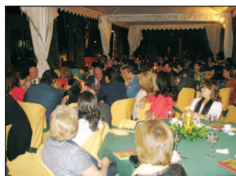
Asistentes a la cena.

Este pueblecito peruano cuenta con una población de más de 20.000 habitantes y está situado en una de las zonas más deprimidas de Latinoamérica, a casi 4.000 metros de altura. Pese a una pobreza extrema que afecta al 88% de la población y una mortandad infantil del 10,7%, una terrible situación laboral y social de la mujer, ade-