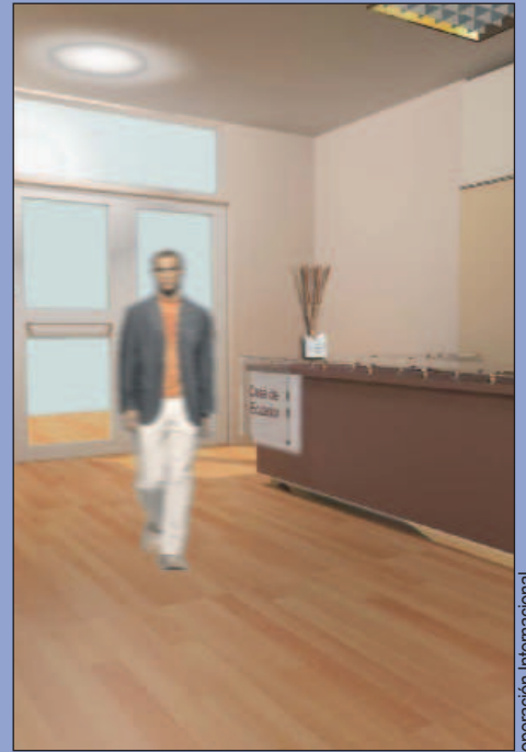
Imagen virtual de la recepción del Centro de Participación Hispano-ecuatoriano.