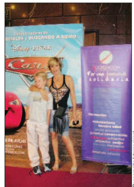
La actriz y presentadora Miriam Díaz Aroca con su hijo.