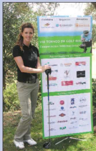
La actriz y presentadora Verónica Mengod, que estuvo apoyando el evento solidario.

Este evento ha sido patrocinado por Fundación Privada Renta Corporación , y ha contado con la colaboración de 10 empresas patrocinadoras de ho-