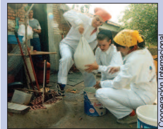
Voluntarios en la Campaña de Operación Rehabilitación de Viviendas.

Cooperación Internacional ONG ha creado la Propuesta de Voluntariado Corporativo , dirigida a las empresas y a sus empleados, a los que se ofrece la posibilidad de realizar labores de voluntariado social en diversas áreas, a través de la participación en las actividades que la ONG organiza.